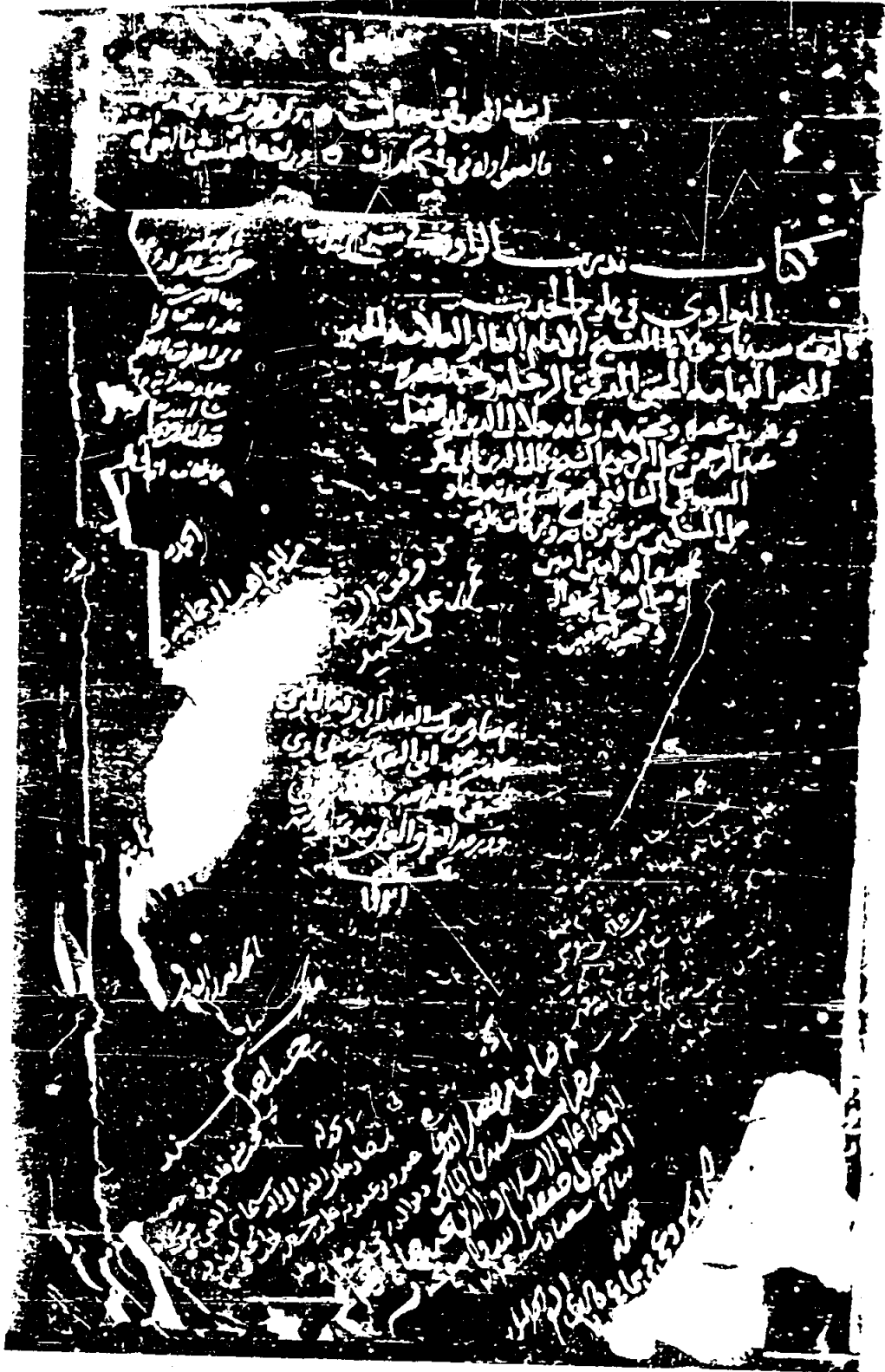
صورة من المخطوط النسخة (ب)